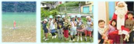
家の前の仁淀川 で子供とドボン

仁淀川のほとりで、 ほどよい田舎・ほどほどに便利、 子どもとのびのび生活におすすめです